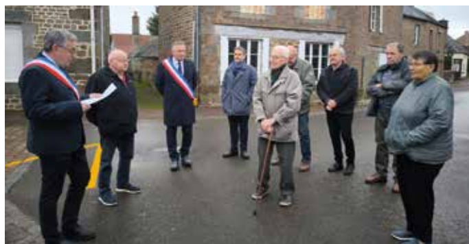
MONUMENTS AUX MORTS DE SAINTE-CROIX ET DE RABODANGES

Comme chaque année, les habitants de la commune déléguée de La Forêt-Auvray ont accompagné les élus pour la commémoration de l'armistice du 11 novembre. Une gerbe a été déposée au monument aux morts en mémoire de ces jeunes partis combattre lors de la première guerre mondiale afin de défendre notre pays et qui ne sont pas revenus dans leur famille. Ils sont vingt-et-un dont les noms sont cités sur le monument, le plus jeune n'avait que vingt ans quand il est décédé.