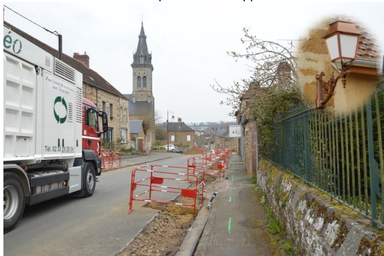
Rue du Docteur Prodhomme

Ces travaux contribuent à la sécurité de l'alimentation électrique, les réseaux électriques souterrains étant moins vulnérables aux aléas climatiques, notamment lors de tempêtes par exemple. A Putanges-Pont-Ecrépin, deux rues se sont embellies de nouvelles lanternes pour l'éclairage public, la rue du Docteur Prodhomme et la rue Maurice Gontier.