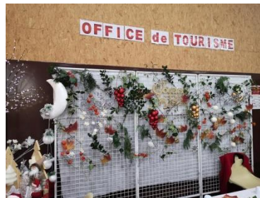
Office de Tourisme