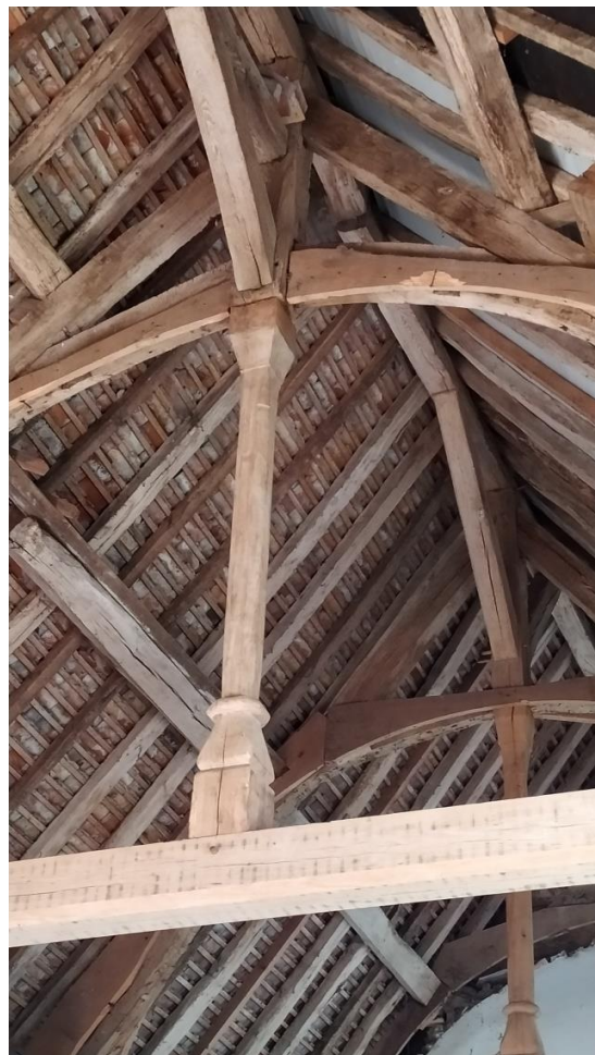
Le poinçon assemblé sur l'entrait, Un travail d'art et d'une grande précision.

Les églises ne sont pas seulement des lieux de culte, ce sont aussi des lieux de culture, comme viennent nous le rappeler les animations, les repas ou les concerts, organisés périodiquement à l'église de Saint-Malo, comme dans d'autres églises.