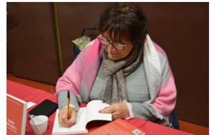
Une femme de lettres