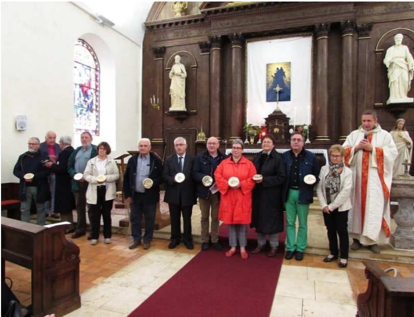
Remise des clous à l'église Saint Pierre de Putanges-Pont-Ecrepin