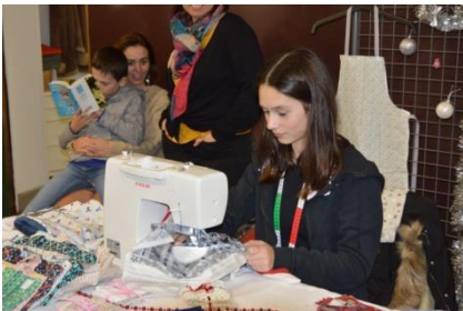
Une future couturière

Félicitations pour cette belle manifestation qui rassemble artisans, producteurs.