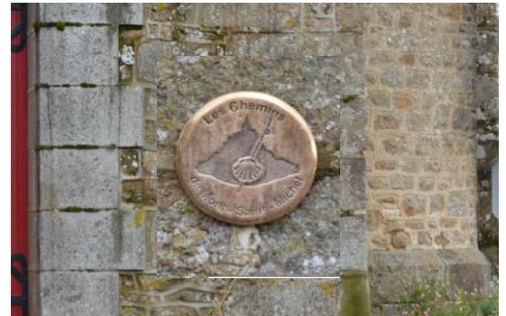
Clou du chemin du Mont Saint Michel fixé sur la façade de L'Eglise de Rabodanges.