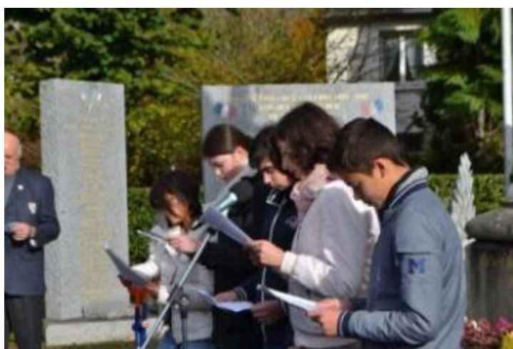
Grand moment de fraternité devant le monument aux morts avec les enfants du collège « Gaston Lefavrais » et les enfants des écoles primaires de Putanges.

dépôts de gerbes par les autorités civiles et militaires. Ce fut un moment solennel au service du devoir de mémoire. Merci, également, à tous ceux qui se sont déplacés pour honorer « les poilus » de la grande guerre.