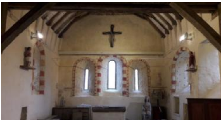
Le chœur de l'Eglise.

Grâce à la volonté de Putanges-Le-Lac et à l'Association des Amis de l'église Saint-Sébastien, le chœur de l'église St Sébastien a été restauré, dans les règles de l'art, par Emmanuelle Cadet, restauratrice de décors médiévaux, et par l'entreprise Taille Pierres et Traditions, spécialiste du bâti ancien. Il a été inauguré en juin dernier.