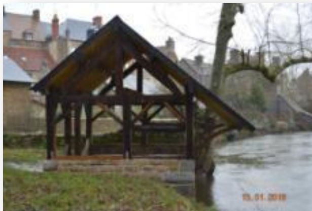
Le lavoir du Friche

Des bénévoles et des employés communaux ont dégagé les pieds du muret, enlevé les planches de bardage, les chevrons en sapin et la plate-forme, avant que les artisans interviennent. Grâce aux photographies de Jean Clérembaux, les travaux ont pu être réalisés à l'identique de ce qu'était le lavoir d'origine. Un projet de sensibilisation à ce patrimoine et au respect du bien public en général a été proposé aux établissements scolaires de Putanges-Pont-Ecrépin. A cet effet, deux panneaux ludiques seront réalisés par les enfants avec l'aide de PEF.