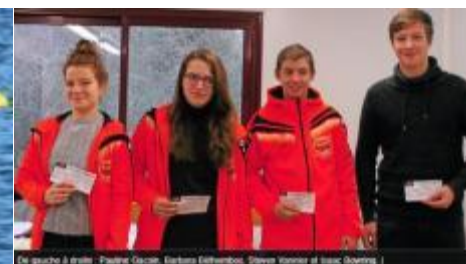
Félicitations aux jeunes sportifs pour leurs résultats obtenus au cours de l'année 2017