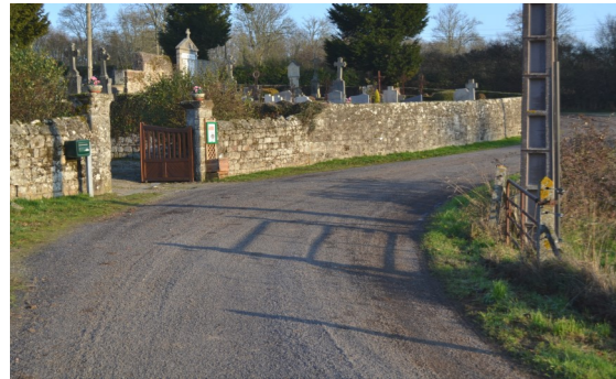
Chemin aux Rotours

Au cours de l'année 2016, des travaux de réfection des routes et chemins de la commune nouvelle ont été réalisés pour un montant d'environ 150.000 €.