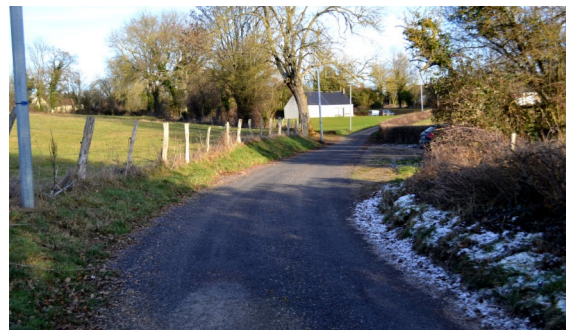
Chemin à Rabodanges