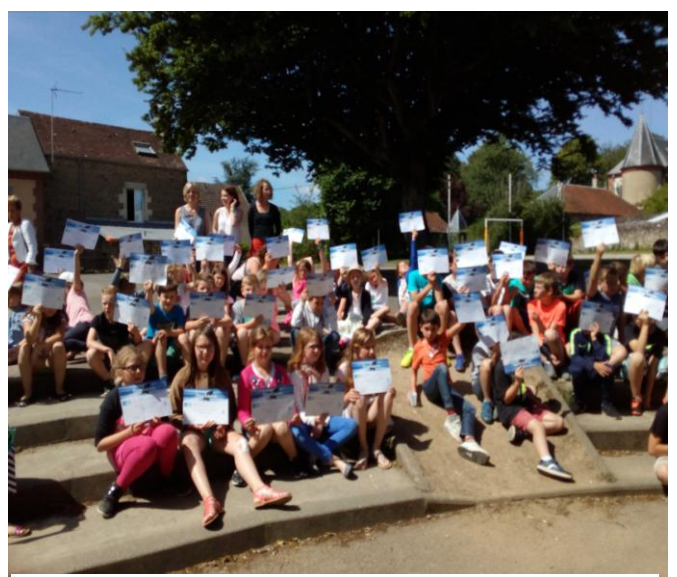
Belle action menée par l'école primaire « Roger Hardy » sensibiliser les enfants à la gestion de l'eau et des déchets.